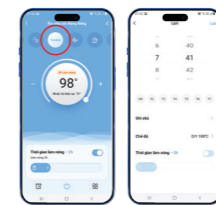
Chế độ gia nhiệt Chế độ hẹn giờ